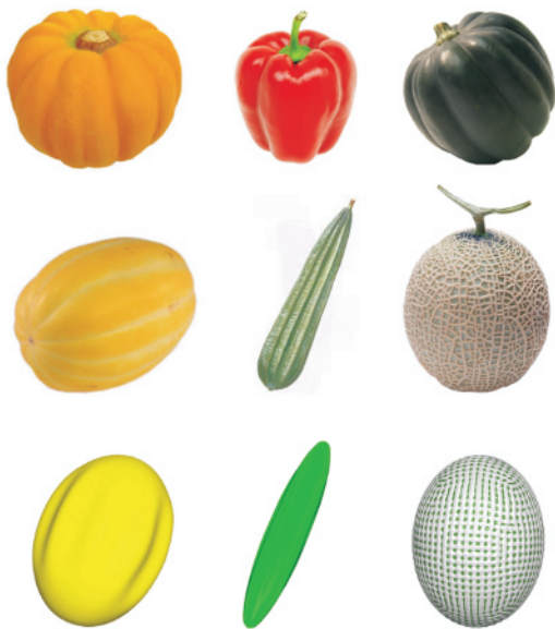
图5 自然瓜果的外观同应力屈曲模型计算结果的比较( 参阅文献 9 ])