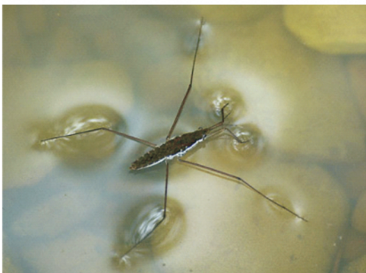
图 2 水的表面张力( 75.6 \text{ mJ/m}^2 )足以托起一根曲别针(上图). 许多生物, 如水黉, 就是靠水的表面张力而从容地浮在水面上的(下图)

带 tension 的另一个物理学词汇是电学里的 electrical tension, 又称 voltage 或 electromotive force (电动势), 是两点之间的电势差, 单位为伏特 (Volt).