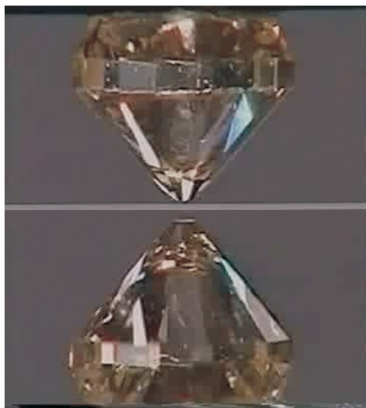
图1 金刚石对顶砧, 由两块加工成近似锥状的金刚石组成。加在较大面积的底部上有限的力会在面积较小的顶部( 对顶到一起) 形成很大的压强

成的有限构型的 Plasmoid 3) , 若没有外在的约束( 压力) 就会无限分散开去。由压力的定义可见, 对于一个物质体系, 当其体积已经很小的时候, 体积的微小变动就意味着大的能量变化, 说明要维持这样的体系需要大的压力。对一个体系施加外部压力, 物质体系并不是简单地各项同性地缩小, 有时候会表现为原子甚至电子排列方式的改变, 即发生相变。若压力诱导的相变不是可逆的, 卸去压力后材料的新物相还可以继续维持存在。由此可见高压物理学( high-pressure physics) 不仅仅能研究物相随压力的变化, 它还是合成新物质、新材料的有效方法。宇宙中大多数物质都是处在高压状态( 星体内部), 因此高压物理还是理解宇宙奥秘的钥匙。利用金刚石对顶砧( diamond anvil cell)( 图 1), 目前人们已经能够实现高达 500GPa 的静压力。