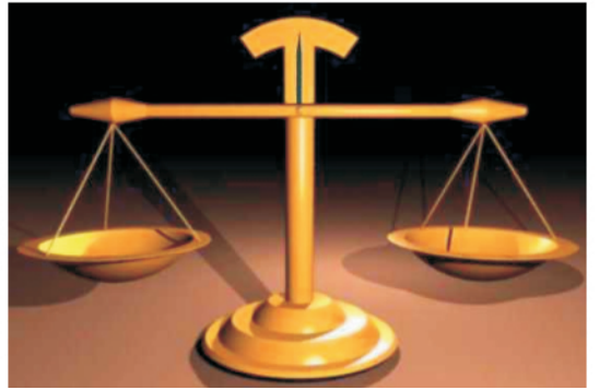
图 2 天平. 西文为 balance(两个盘子)

等号的形象为“=”,是水平的、等长的两个短杠.如果将一根均匀的杆关于一个支点给放稳了,其形态就是水平的.这里就引出了平衡的概念.日常生活中我们谈论平衡的概念时,比如讨论饮食平衡时,用的英文词为 balance(名词和动词形式相同,过去分词 balanced 可作为形容词用). Balance 源自拉丁语 bilancia 或 bilanx(bis + lanx),即两个盘子(见图 2),汉译天平.天平等臂长,所以待称的物品和砝码(质量标准)应该等量.与此相比照,中国的杆秤关于支点的两侧则是不等长的,实际上在质量标准(秤砣)一侧其作用长度是可变的、带刻度的.显然,中国的杆秤相对于天平来说科学的多,它可以直接读取结果,只用很少的质量标准(一般针对两套刻度只是选取两个不同的支点,使用同一个秤砣.有时也配两个秤砣.)(见图 3).但天平虽然相对于杆秤来说非常不经济,只利用了杠杆原理的一个特例,可它更直观、更精确,适于小质量物体的称量.大致说来,天平适合药剂师抓药,杆秤适合官员们分金.