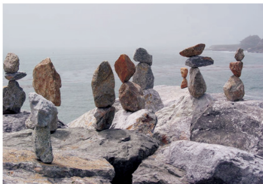
图5 微妙的不稳定平衡

平等的概念植于社会生活中,是有暗示功能的. 社会关系里强调与“平等”类似的等价关系( equivalence )时,似乎是将之看作一种单向的关系,比如我