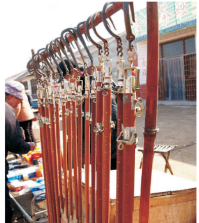
图 3 杆秤. 杆秤连同秤砣和待称物品一起被从支点处吊起,滑动秤砣的位置使秤杆(朝尾端渐细)处于水平状态,则此时秤砣的位置就是待称物品质量的读数.有时,一杆称配两个秤砣,秤杆上有类似计算尺似的两套刻度.杆秤是量具,更是艺术品

天平与杆秤的共通之处是处于称量状态时其杆必须是水平的,这种状态,英文是 balanced,中文为平衡(即衡器是水平的).但中文平衡,或平衡态,又被用来翻译另一个非常重要的物理学概念 equilibrium(复数 equilibria). Equilibrium,拉丁语原文为 aequilibrium = aequus + libra,词头 aequus 即现代英文的 equal,而 libra 可就值得详细讨论了. Libra 指慢慢地来回移动,天平接近平衡时其臂(beam)的上下运动,也即不倒翁的运动(见图 4).因为 librium 表现在天平接近可读数状态的形象,它被引申为所称量物品的单位.现代英语中的重量单位磅(对 pound 的音译,其本意为重量),简称为 lb 或 L 就是